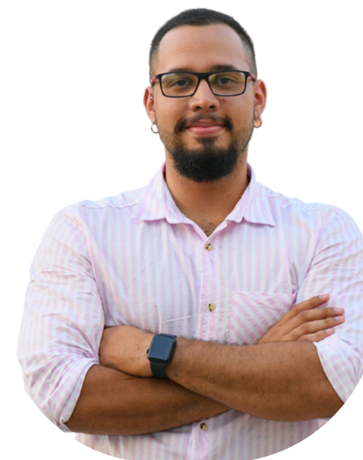
Pablo González Audiovisual